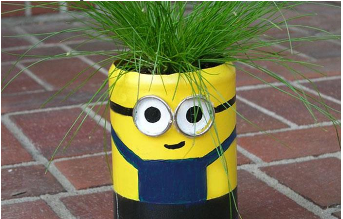
Maceta minion

Os planteamos una simpática maceta para plantar pequeñas flores o plantas aromáticas con forma de Minion. También puedes convertir una botella en un lapicero, por ejemplo. El límite es tu imaginación.